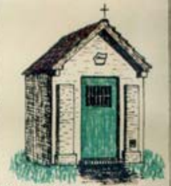
Kapel van O-L-Vrouw van Bristand