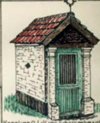
Kapel van O-L-V van Scherpenheuvel