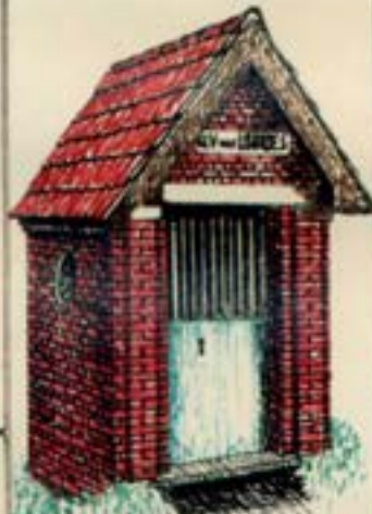
Kapel van O-L-Vrouw van Lourdes