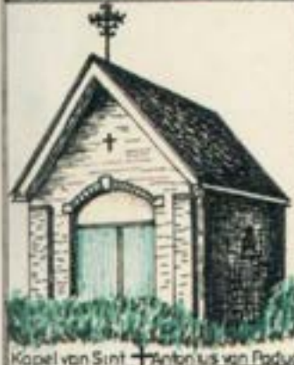
Kapel van Sint-Anthonis van Padua