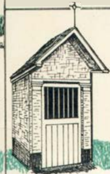
Kapel van O-L-Vrouw van Bristand