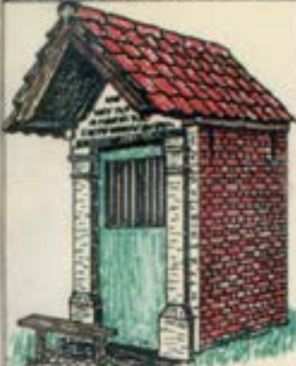
Kapel van O-L-Vrouw van Bristand