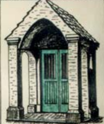
Kapel van Sint-Anthonis van Padua