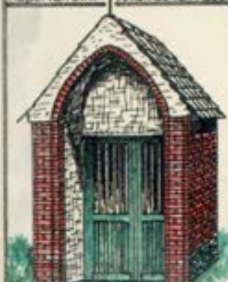
Kapel van O-L-Vrouw van Heilig Hart